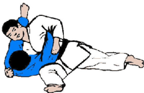
KUZURE KESA GATAME (odmiana trzymania opasującego)