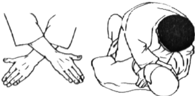
NAMI JUJI JIME (naturalne duszenie krzyżowe)